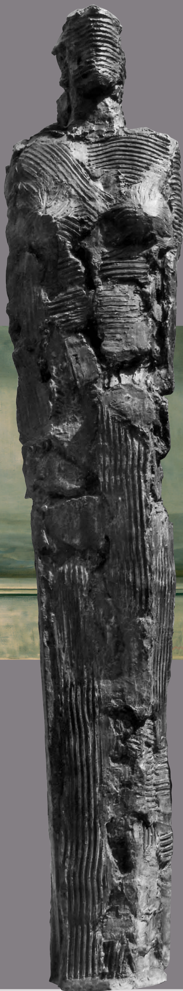
Ivo Soldini, Skulpturen

11. Oktober bis 7. November 2009 10. Oktober 18 bis 21 Uhr Vernissage